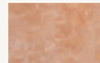
仕上がり状態の色 (研磨後)